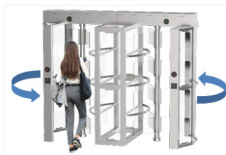
Fire Safety Requirements, Arms open automatically