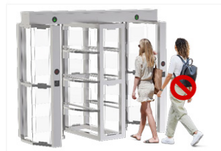
Anti-Trailing-Funktion: Es kann jeweils nur eine Person passieren